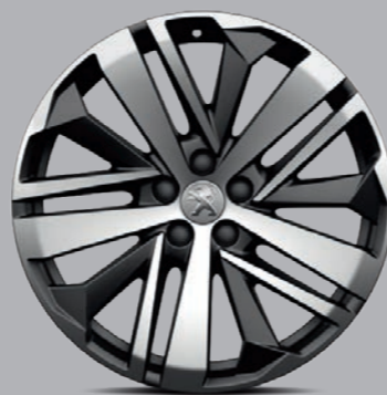
Leichtmetallfelge 19" „Boston“, zweifarbig 3)