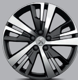
Leichtmetallfelge 18" „Detroit“, zweifarbig 1)

Um Ihr ganz persönliches Modell zu vervollkommen, stehen Ihnen drei verschiedene, hochwertige Leichtmetallfelgen zur Verfügung.