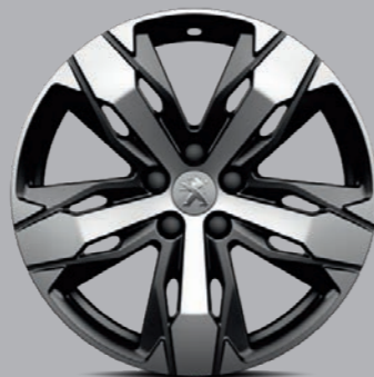
Leichtmetallfelge 18" „Los Angeles“, zweifarbig 2)