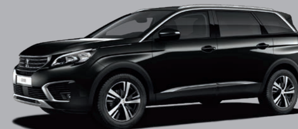
Perla Nera Schwarz